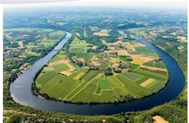
Le Cingle de Trémolat