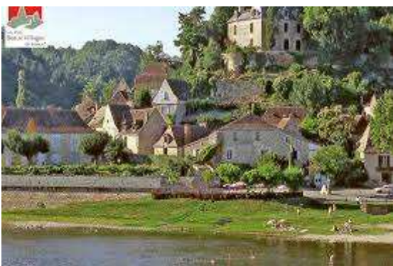
Limeuil, Village classé