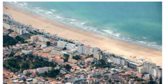
St Jean de Mont