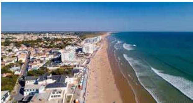
St Gilles Croix de Vie