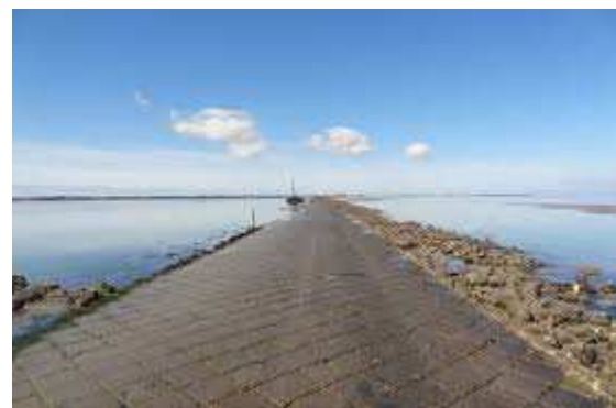
Île de Noirmoutier et le passage du gois